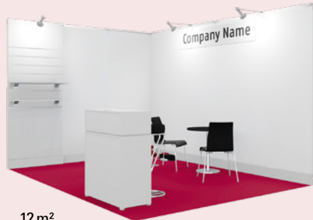
12 m 2