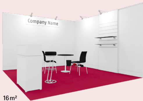
16 m 2