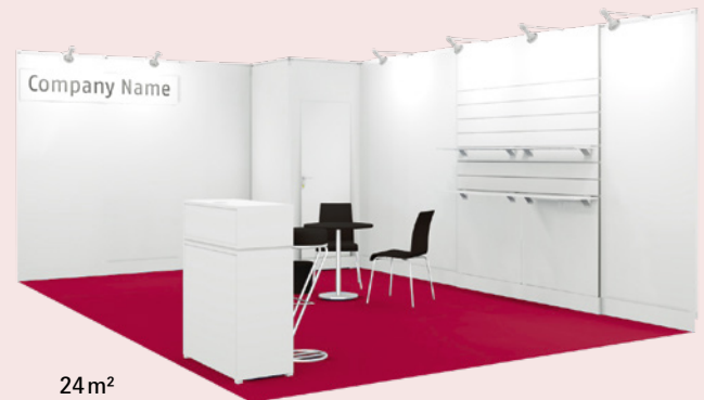
24 m 2